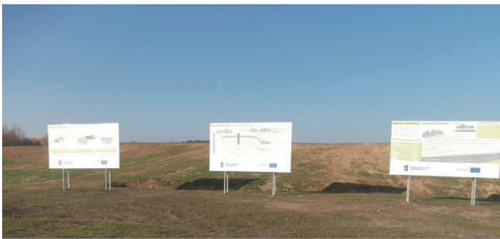
W ramach rekultywacji wykonano między innymi prace edukacyjne.

Kolejnym etapem eksploatacji składowiska odpadów lub jego czyszczenia jest przeprowadzenie odpowiedniego procesu rekultywacji. Istotnym elementem jest stworzenie poprzez odpowiednie zabiegi techniczne i uprawowe, warunków uciążliwych i krajobrazowych zdegradowanemu środowisku. W minionym perspektywie finansowej samorząd Warmii i Mazur z powodzeniem sięgnął po środki z Unii Europejskiej, aby skutecznie zrehabilitować składowiska odpadów na swoich terenach.