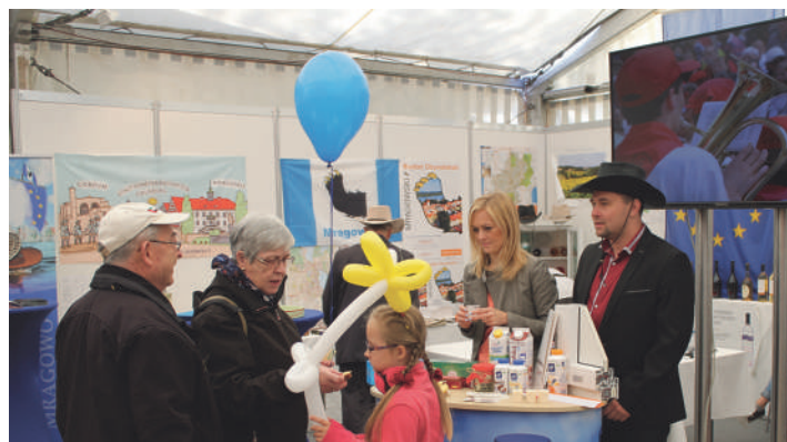
Najwi kszym powodzeniem cieszyła si Ma lanka Mragowska i inne wyroby SM Mlekpól.