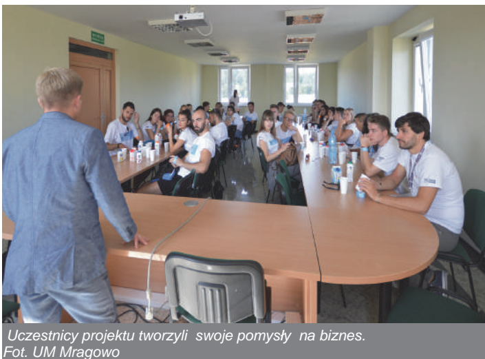
Uczestnicy projektu tworzyli swoje pomysły na biznes.