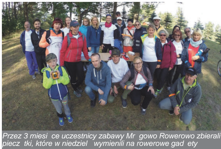
Przez 3 miesiące uczestnicy zabawy Mr gowo Rowerowo zbierali pieczki, które w niedzielę wymienili na rowerowe gadaty

Idea przesiadania się na rower zyskała wielu sympatyków zarówno wśród mieszkańców, jak i osób odwiedzających Mr gowo. W projekcie gościliśmy Czarkę Makiewiczą, który jak się okazało na swój pierwszy Piknik Country przyjechał do Mr gowa rowerem, a także młodzież z międzynarodowego projektu Business for Youth i Business 4U, która dzięki uprzejmości mr gowskich hoteli mogła na rowerach odwie-