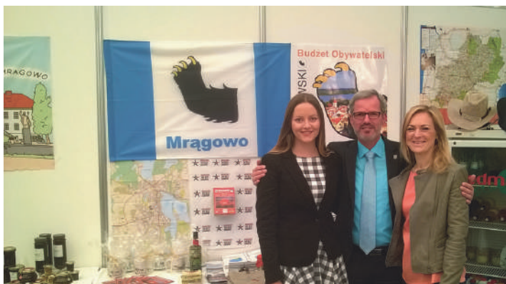
Na zdj ciu burmistrz miasta Grünberg - Frank Ide, na stosiku promocyjnym Mr gowa.