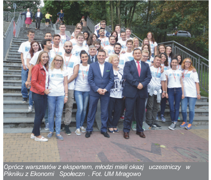
Oprócz warsztatów z ekspertem, młodzież miała okazję uczestniczyć w Pikniku z Ekonomii Społecznej.

Uczestnicy w ramach projektu wizytowali także Mrągowskie firmy i poznawali doświadczenia tych, którzy w biznesie osiągnęli sukces. Odwiedzili m.in. Spółdzielnię Mleczarską „MLEKPOL”, Firmę AdamS H.P. z dziedziczących, a w Centrum Handlowym „Fabryka” nowo powstały Inkubator Przedsiębiorczości. Dzięki uprzejmości i wsparciu Hotelu Mercure Mrągowo, Hotelu Mazurka, Hotelu Anek oraz Informacji Turystycznej, młodzież do firm przyjechała na rowerach, by promować ideę społecznie odpowiedzialnego biznesu oraz lokalnego projektu „Mrągowo Rowerowo”, zachęcając do aktywności rowerowej, w tym